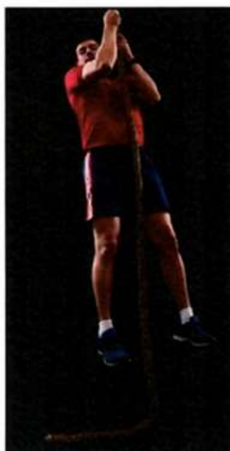
Imagem 8 – Subida na corda – Execução