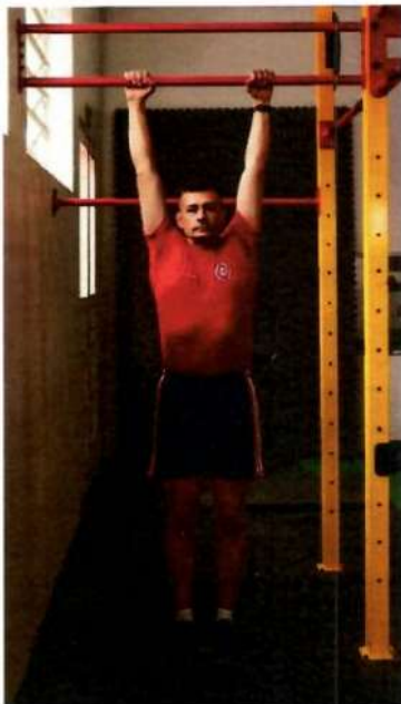
Imagem 1 – Flexão de Braços na Barra – Posição Inicial e posição Final (onde ocorre a contagem).