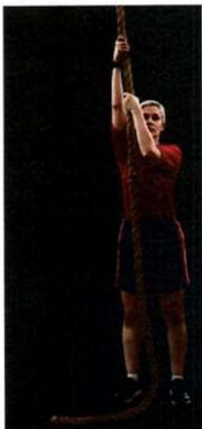
Imagem 9 – Subida na corda – Posição Inicial