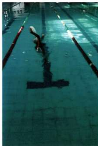
Imagem 16 – Natação - Percurso