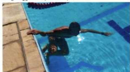
Imagem 13 – Natação - Posição Inicial