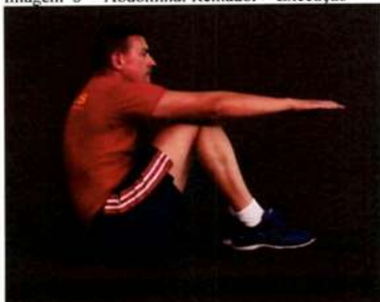
Imagem 6 – Abdominal Remador – Execução