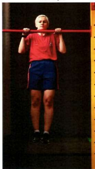
Imagem 4 – Flexão de Braços na Barra Isometria Execução