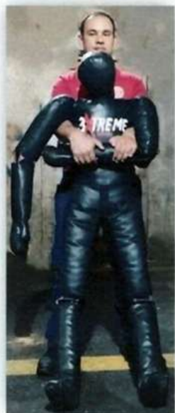
Imagem 11 – Simulação de resgate – Execução