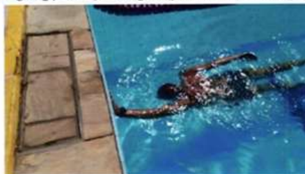
Imagem 14 – Natação-Chegada (piscina 50m)/Virada (piscina 25m)