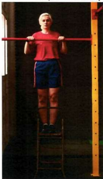
Imagem 3 – Flexão de Braços na Barra Isometria Posição Inicial com apoio