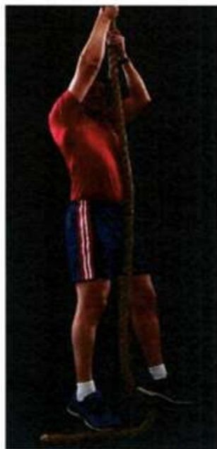
Imagem 7 – Subida na corda – Posição Inicial