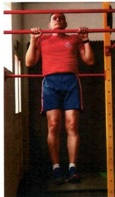
Imagem 2 – Flexão de Braços na Barra – Execução