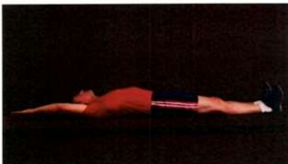
Imagem 5 – Abdominal Remador – Posição Inicial e posição Final (onde ocorre a contagem).