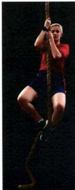
Imagem 10 – Subida na corda – Execução